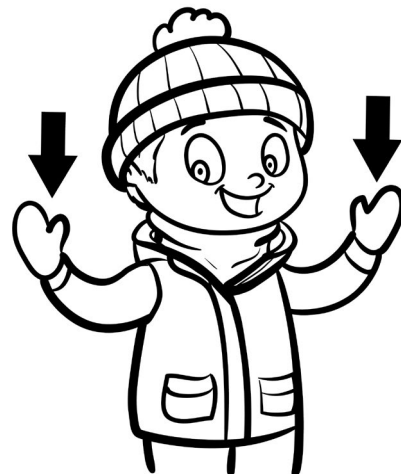
Illustration: ©Amélie Pepin – www.ameliepepin.com