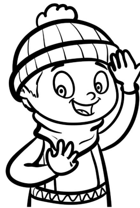
Illustration: ©Amélie Pepin – www.ameliepepin.com