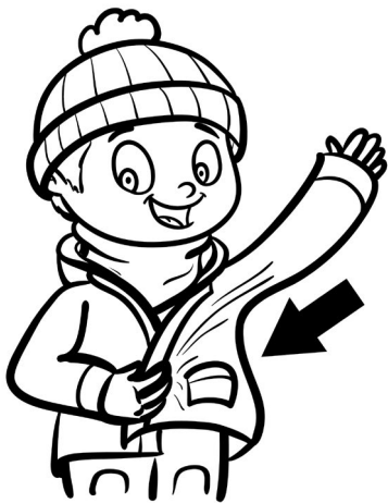
Illustration: ©Amélie Pepin – www.ameliepepin.com