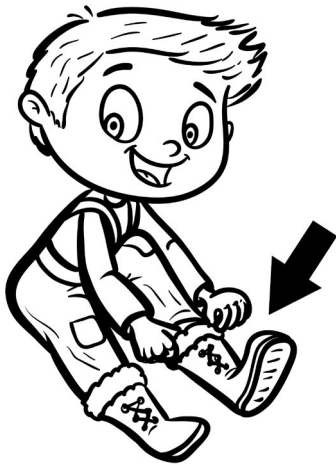
Illustration: ©Amélie Pepin – www.ameliepepin.com