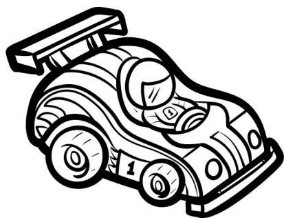
une voiture de course