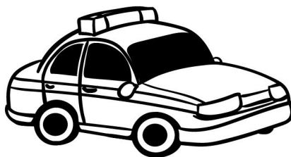
une voiture de police